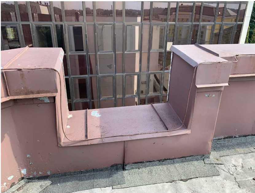
ZVÝŠENÁ ČÁST ATIKY NAD KRAJNÍ SCHODIŠTOVOU VĚŽÍ