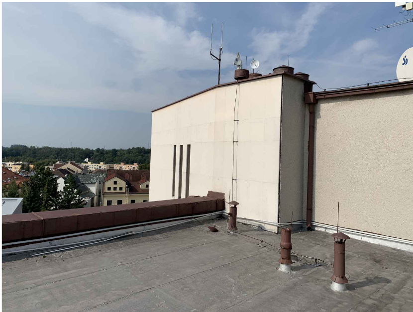
STŘEŠNÍ NÁSTAVBA SCHODIŠTĚ