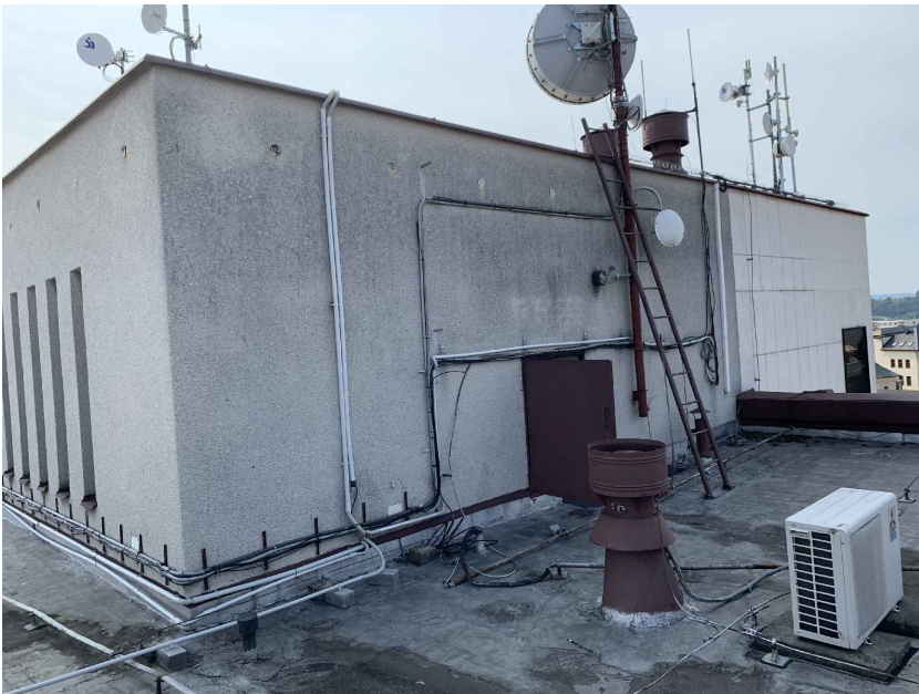
STŘEŠNÍ NÁSTAVBA SCHODIŠTĚ - VÝLEZ NA STŘECHU "A"