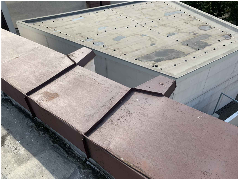
OPLECHOVÁNÍ ATIKY V MÍSTĚ STÁVAJÍCÍCH PILASTRŮ